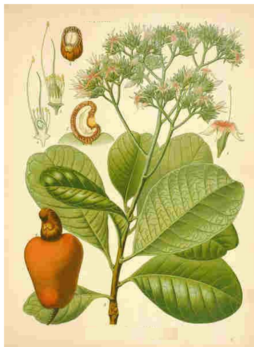
Hình 1: Hình thái hoa và trái điều

Trái: Thuộc loại trái nhân cứng (hạt điều), là phần phát triển từ bầu noãn. Sau khi thụ phấn, bầu noãn sẽ phát triển nhanh và đạt kích thước trung bình dài 2,6 – 3,1 cm; ngang 2 – 2,3 cm, còn phần trái giả phát triển sau từ đế hoa. Thời gian trái phát triển kéo dài từ 2-3 tháng.