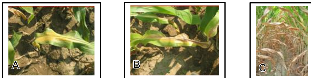
Hình 1: (A); (B); (C) Các triệu chứng thiếu đạm trên lá ngô.