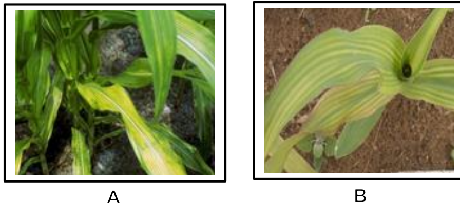
Hình 4: (A); (B) Triệu chứng thiếu Magiê điển hình trên cây ngô.