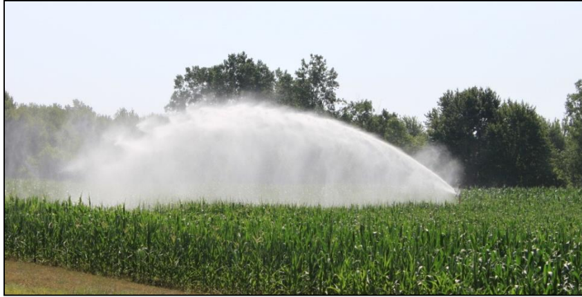
Hình 3: Có thể áp dụng kỹ thuật tưới phun cho ngô.