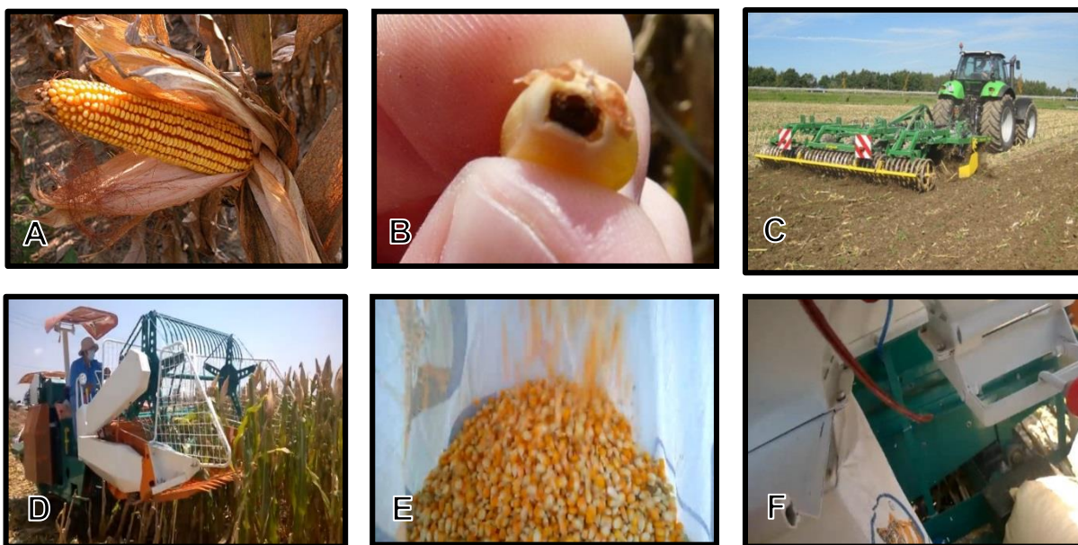
Hình 5: (A) Quan sát hạt ngô ở đầu trái và cuối trái; (B) Lá bao khô + hạt cứng + lớp màu đen ở chân hạt; (C) Cày vùi lại thân lá cho vụ sau; (D) Thu hoạch trái ngay trên đồng; (E) Cho hạt vào bao; (F) Đóng bao hạt ngô sau tách hạt.

Thân lá cây ngô sau khi thu hoạch nên cày vùi tại ruộng nhằm giúp cải tạo đất và cung cấp dinh dưỡng cho vụ sau.