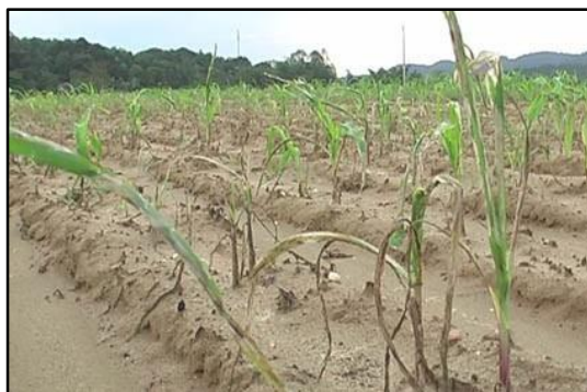
Hình 4: Ruộng ngô bị ngập úng.