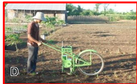
Hình 1: (A) Vệ sinh ruộng trồng ngô; (B) Chọn hướng, với mục đích; (C) Cày đất; (D) Rạch hàng, bổ hốc