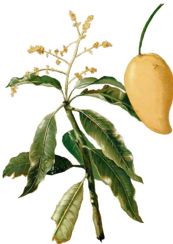
Hình 1: Hình thái của hoa, lá và trái xoài.